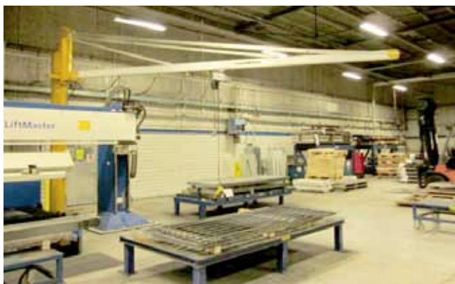
Svingkran til håndtering af emner.