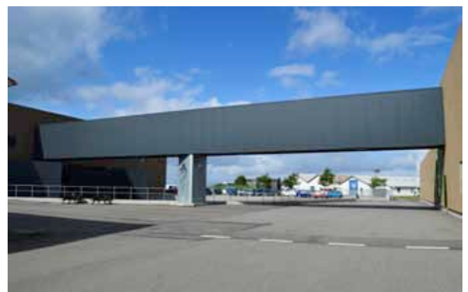
Automatisk rullebaneanlæg mellem to bygninger.

Effektive løsninger inden for intern håndtering og logistik