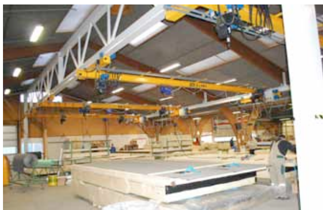
Krananlæg til flytning af elementer.